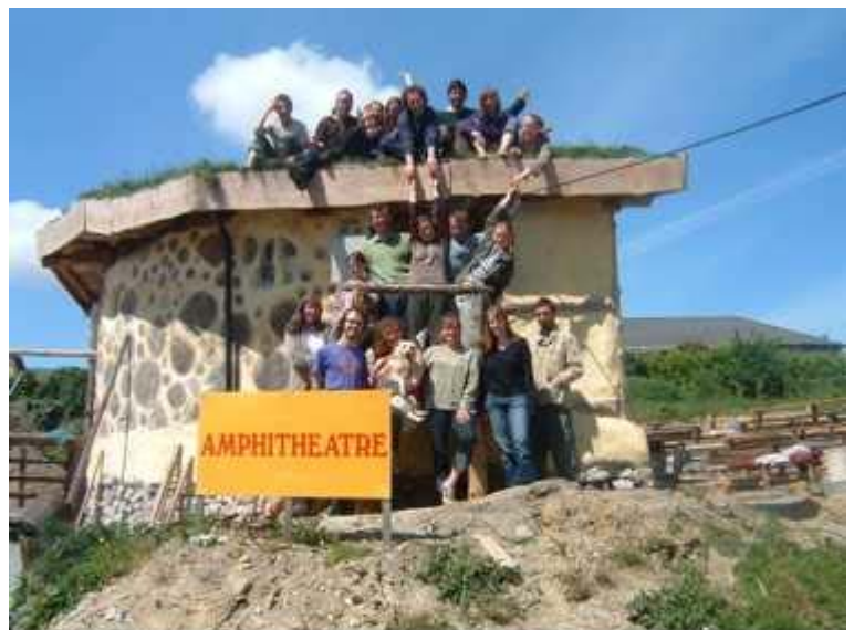
Fotografía de fin de año 2005, mostrando el anfiteatro construido en cob y postes de leña, terminado justo a tiempo para la primera presentación

En Septiembre del 2004, en su primer día de clase, los estudiantes vieron un documental recién aparecido por entonces: "El Fin de los Suburbios" (también era la primera vez que yo lo veía), y después, un poco más tarde, el mismo día vino el Dr. Colin Campbell de la Asociación de Estudios sobre el Pico del Petróleo, a dar una conferencia. El efecto combinado de ambas experiencias fue muy fuerte para los estudiantes. Les enfocó la mente, y todos vivieron una especie de shock, incluyéndome. "El Síndrome del Estrés Post-Petróleo" se manifestó de diversas maneras. Una vez que la mente se aquietó, pudo surgir la idea de un proyecto que llevaría a explorar a los estudiantes de permacultura del