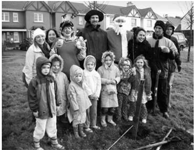
Una plantación comunitaria de nogales organizada en Navidad por Kinsale Pueblo en Transición, Diciembre de 2007

Un obstáculo en el proceso de Kinsale, y quizás la razón principal por la que no ha avanzado más, es que de acuerdo a los "Doce Pasos" a seguir en un proceso de Iniciativa de Transición, lo cual se ha desarrollado en la Tercera Parte (ver Capítulo 11), Kinsale comenzó directamente con el número doce, sin abocarse a los once pasos precedentes. Esto en efecto significó que el proceso no se implantó sobre una sólida concientización comunitaria, que no tuvo sobre sus espaldas el impulso que genera el evento de "Soltar Amarras", no salió desde iniciativas de grupos locales, sólo se basó en un único Día de Espacio Abierto, y además no se había hecho ningún trabajo con las personas mayores de la comunidad. Por intermedio del