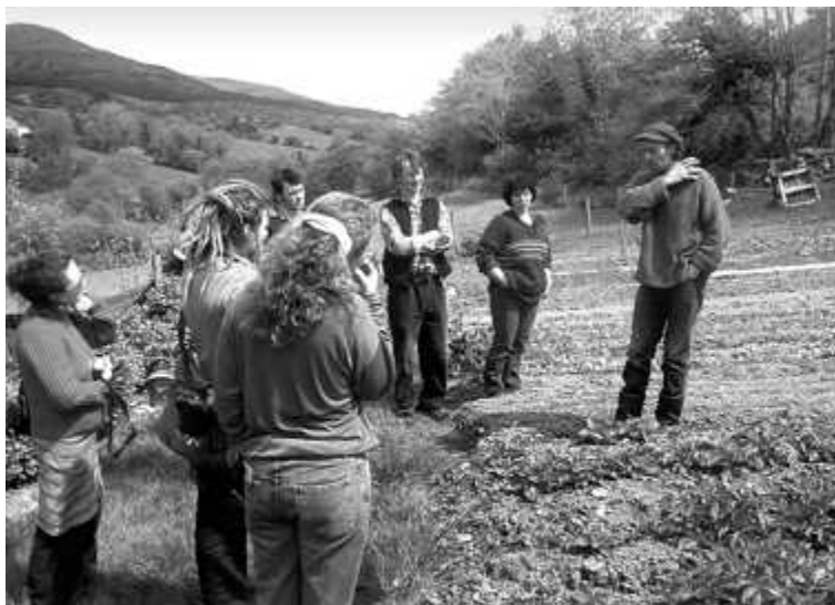
Estudiantes visitando una granja orgánica local como parte de su investigación para el KEDAP

El KEDAP surgió a partir de un programa comunitario de "tanques de pensamiento", de un aumento del nivel de conciencia, del trabajo de los estudiantes, y de la varias personas de la región que tenían ideas para aportar. Es útil preguntarse qué es lo que podríamos haber hecho diferente, y de hecho, si tal cosa hubiera justificado la diferencia. En primer lugar, aquí van algunas reflexiones sobre cómo podría haberse hecho diferente.