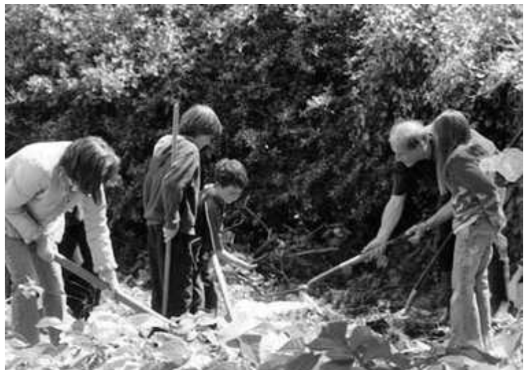
Estudiantes y residentes locales trabajando en el bancal de las calabazas en la huerta comunitaria de Kinsale

Además llevan a cabo diferentes actividades: