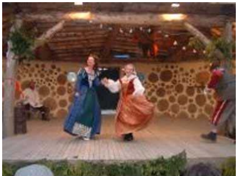
La noche inaugural de " Las Alegres Comadres de Windsor " en el anfiteatro de barro y postes

El proyecto del anfiteatro en el Centro de Formación Profesional que fue terminado en mayo de 2005 logró que el colegio apareciera en el mapa. Muchos de los que acudieron a ver la obra " Las Alegres Comadres de Windsor ", puesta en escena por los alumnos de teatro, hablaron luego de la mágica sensación que les produjo el lugar. La combinación de un centro educativo con cursos interesantes, más proyectos innovadores y prácticos, logró que la comunidad sintiera muy buena predisposición para aceptar el Plan de Acción cuando fue presentado. Al